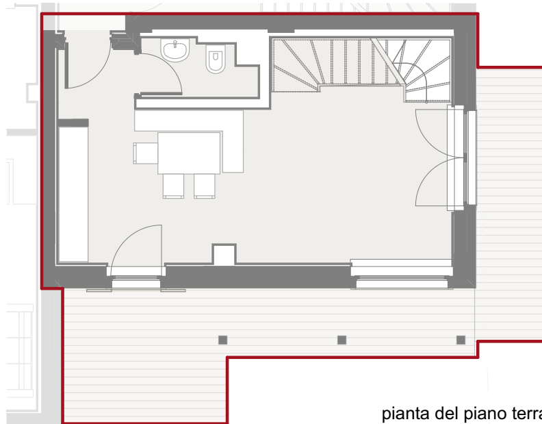
pianta del piano terra